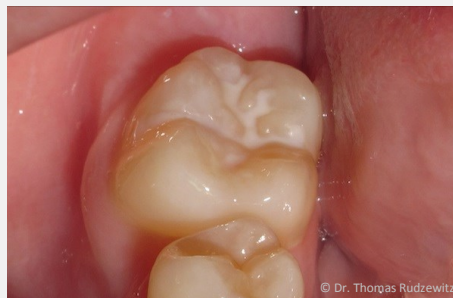
Schutz vor Karies: Versiegelung der feinen Grübchen auf der Kaufläche

Bei der Versiegelung werden die Fissuren mit einem hellen Kunststoff dauerhaft verschlossen, so dass an diesen Stellen keine Karies mehr entstehen kann (siehe Abb. unten).