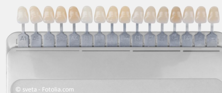
Farbskala zur Bleaching-Kontrolle

Wie schnell die Zähne wieder etwas dunkler werden, hängt davon ab, wie Sie sich ernähren und welche Genussmittel Sie konsumieren: Wenn Sie viel Tee, Kaffee, Rotwein oder Cola trinken und rauchen, werden sie schneller wieder dunkler. Wenn nicht, bleiben sie jahrelang hell.